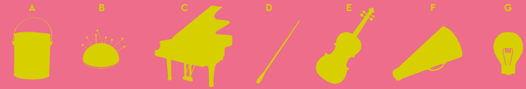
1B le costumier imagine les costumes - 2R le metteur en scène fait travailler les chanteurs et les musiciens pendant les répétitions et il les dirige pendant les représentations. 3C le compositeur écrit la musique - 4E le musicien joue de son instrument. 5A le décorateur crée les décors - 6D l'éclairagiste les lumières - 7D le chef d'orchestre prépare musicalement les chanteurs et les musiciens pendant les répétitions et il les dirige pendant les représentations.