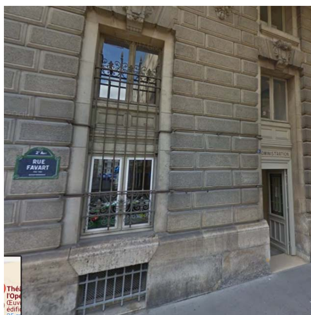
Entrée PMR : 5 rue Favart 75002 Paris