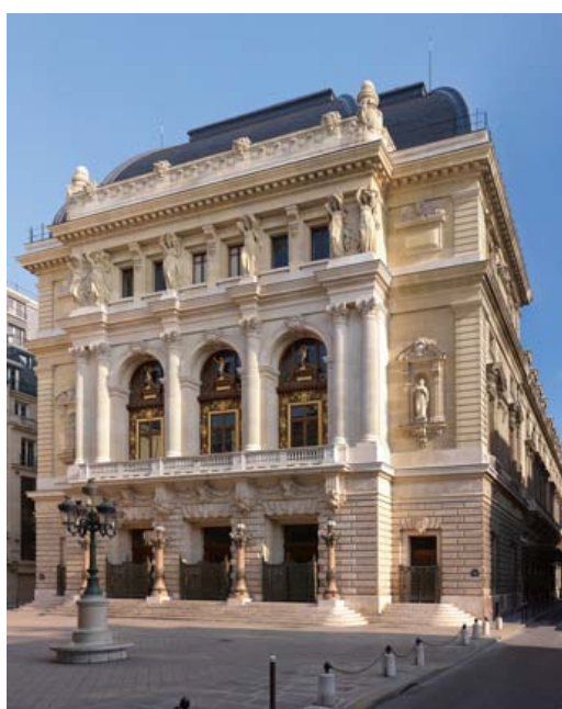
1 Place Boieldieu 75002 Paris