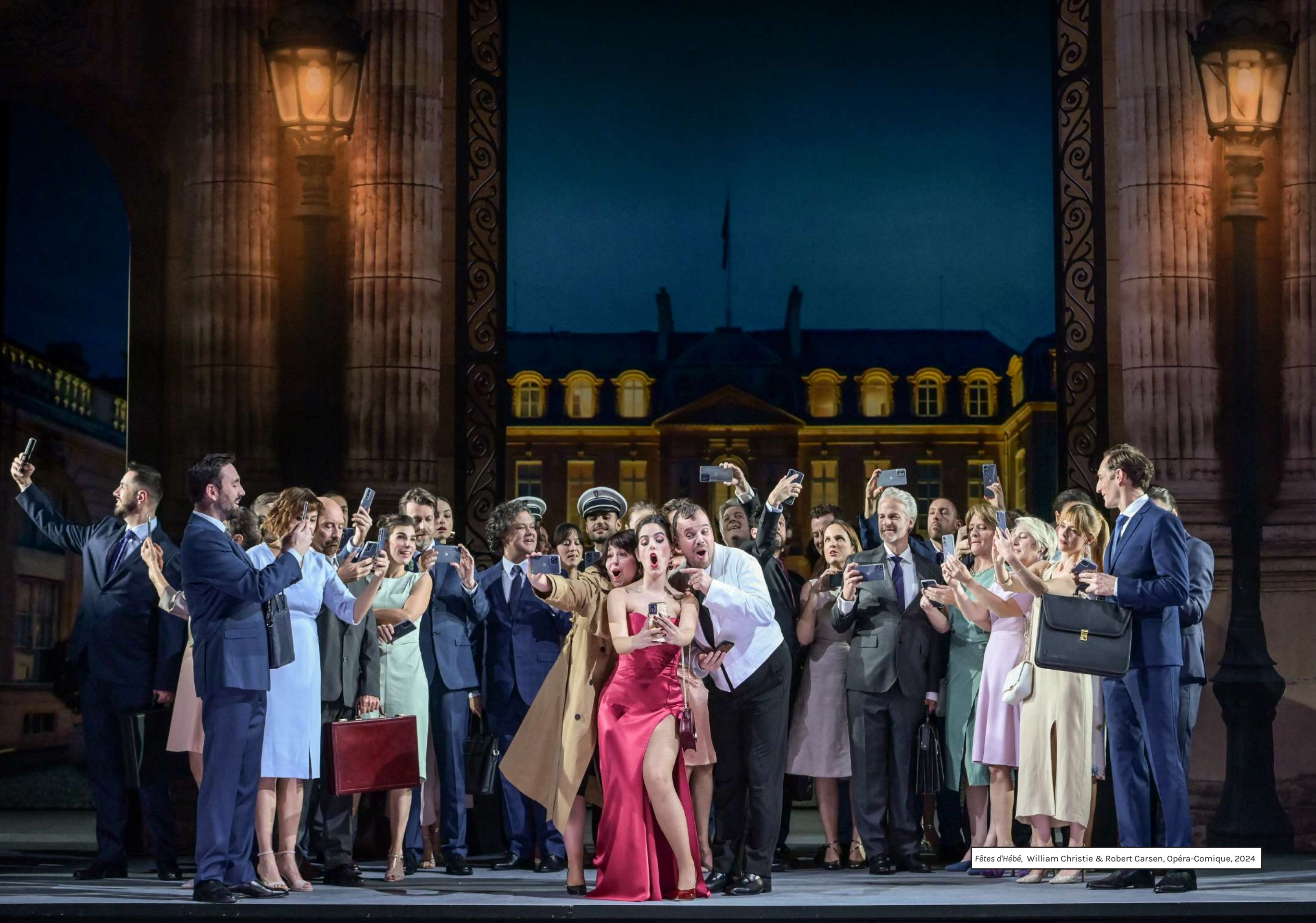
Fêtes d'Hébé, William Christie & Robert Carsen, Opéra-Comique, 2024